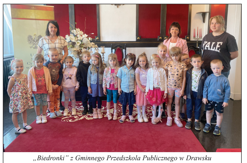
„Biedronki” z Gminnego Przedszkola Publicznego w Drawsku