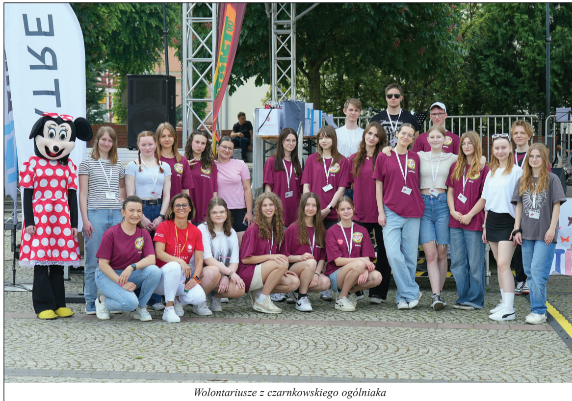
Wolontariusze z czarnkowskiego ogólniaka

Na zakończenie kierujemy słowa wielkiego uznania i podziękowania do wolontariuszy RCWC, wolontariuszy SKC Zespołu Szkół im. Józefa Nojego i Liceum Ogólnokształcącego w Czarnkowie, wspólnot pa-