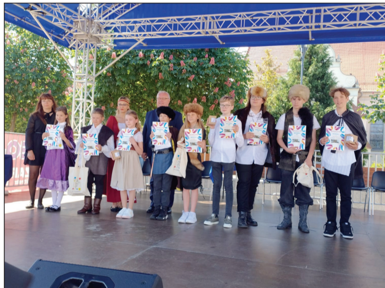
Laureaci w konkursie literackim

gram artystyczny, w którym występowali uczniowie szkoły ze swoimi nauczycielami. W strojach z epoki czytano fragmenty Trylogii, tańczono krakowiaka, śpiewano piosenki. Na zakończenie uroczystości uczniowie najstarszych klas zatańczyli poloneza. Wypadło znakomicie i na pewno przyda się w przyszłości na balu maturalnym. Najbardziej widowiskową częścią Święta Patrona był szkolny korowód, który przemaszzerował dwukrotnie trasą szkoła - Plac