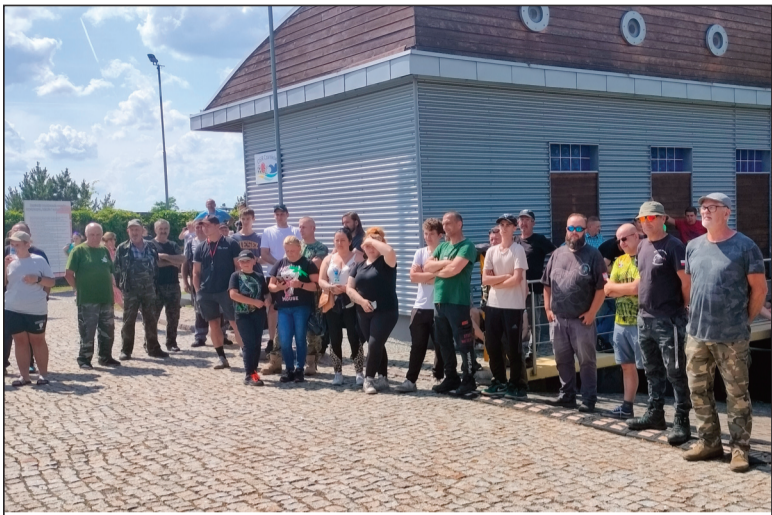
Świętowanie jako pierwsi rozpoczęli wędkarze

Głównym celem tego spotkania była promocja szlaku wodnego pod wspólną nazwą Wielka Pętla Wielkopolski oraz turystyki i rekreacji opartej o trasy wodne. Wielka Pętla Wielkopolski to najdłuższy w Polsce szlak wodny. Niemal 700 kilometrów dróg wodnych, które oplatają całą Wielkopolskę obejmując dwie największe rzeki regionu: Wartę i Notec, a także sieć kanałów oraz połączonych z nimi jezior we wschodniej części Wielkopolski. Wielka Pętla