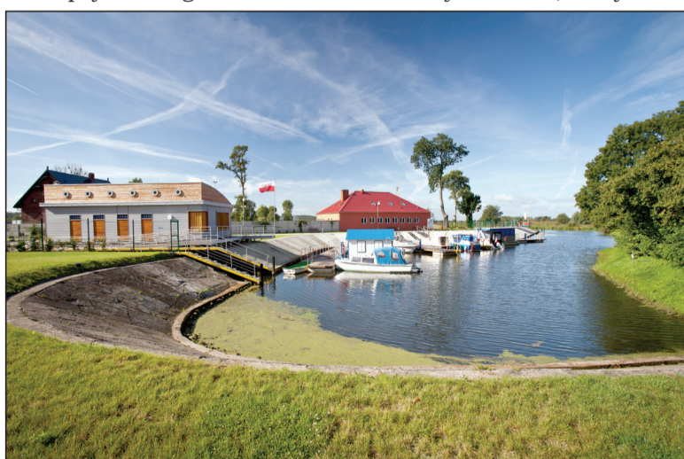
Przystań w Czarnkowie dysponuje wszelkimi usługami jakie chciałby spotkać turysta. To miejsce dobre do wypoczynku przy grillu lub w kajaku czy łódce