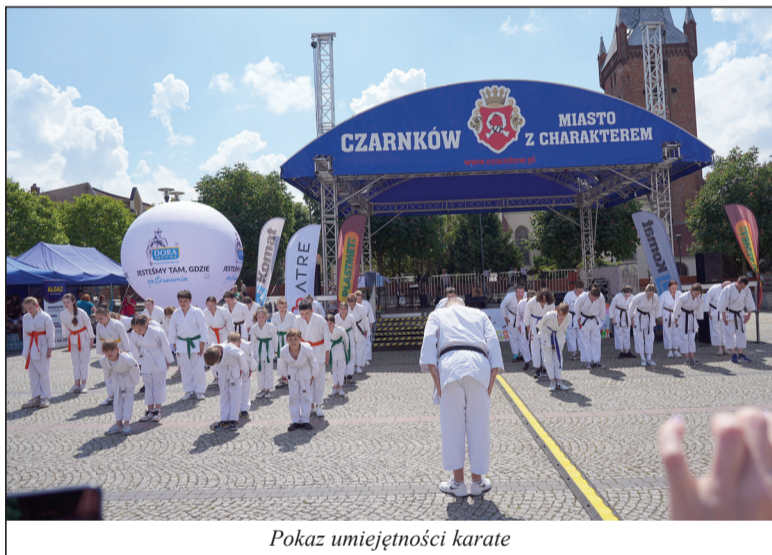
Pokaz umiejętności karate

Pragnąc ideę miłosierdzia zamienić na działanie dla drugiego człowieka, Regionalne Centrum Wolontariatu Caritas wraz z grupami duszpasterskimi działającymi przy parafii pw. św. Marii Magdaleny, angażując wiele osób oraz instytucji dobrej woli zorganizowało już po raz trzeci Piknik Integracyjno - Charytatywny.