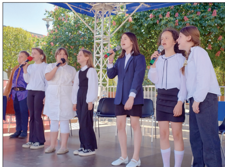
Wokalne popisy uczniów

- Przede wszystkim w szkole działa Zespół ds. Patrona, który koordynuje wszelkie przedsię-