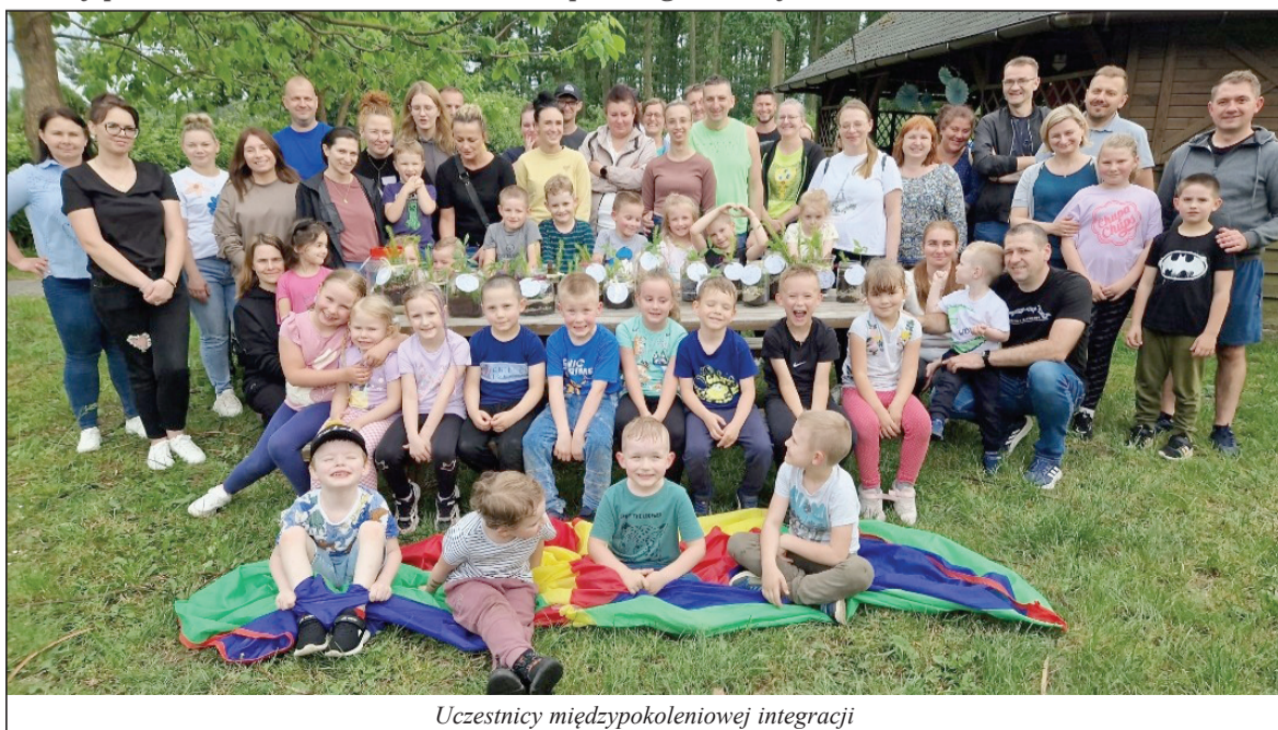
Uczestnicy międzypokoleniowej integracji