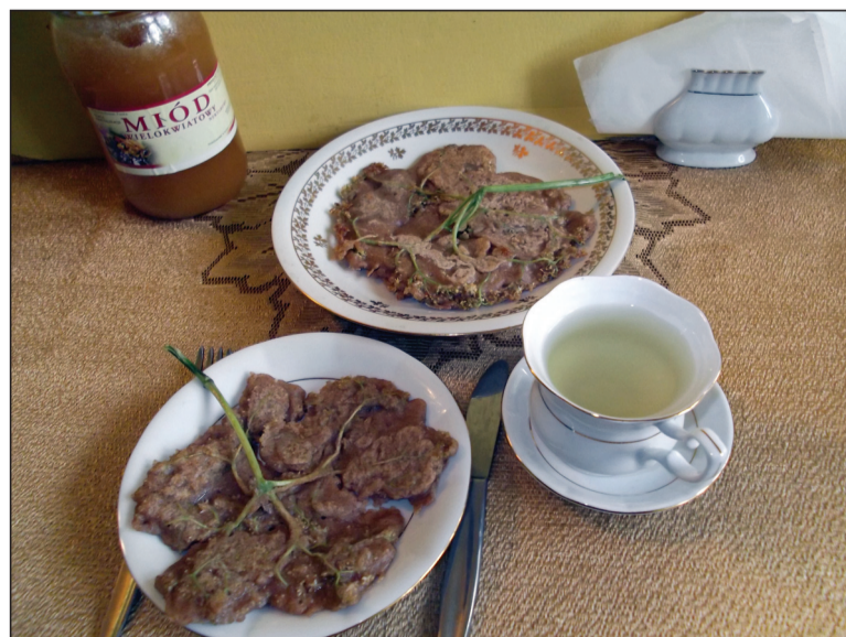
Hyćkowe naleśniki i herbatka z hyćki