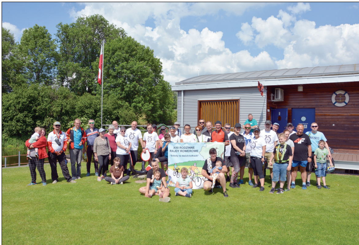
Wspólna fotografia na terenie czarnkowskiej przystani rzecznej

leśnym duktem. Grząski i zwyczaj piasek nieco utwardziły wcześniejsze obfite opady deszczu, choć i tak nie brakowało miejsc, przez które wielu przeprowadzało rowery, niemniej dla uroku trasy było warto. Z powodu braku zwyczajowego półmetka obie grupy spotkały się na mecie, którą wyznaczono na terenie przystani rzecznej. Pieczoną nad ogniskiem kiełbasę, stanowiącą zwyczajowy