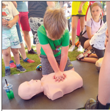
Zajęcia z ratownikami