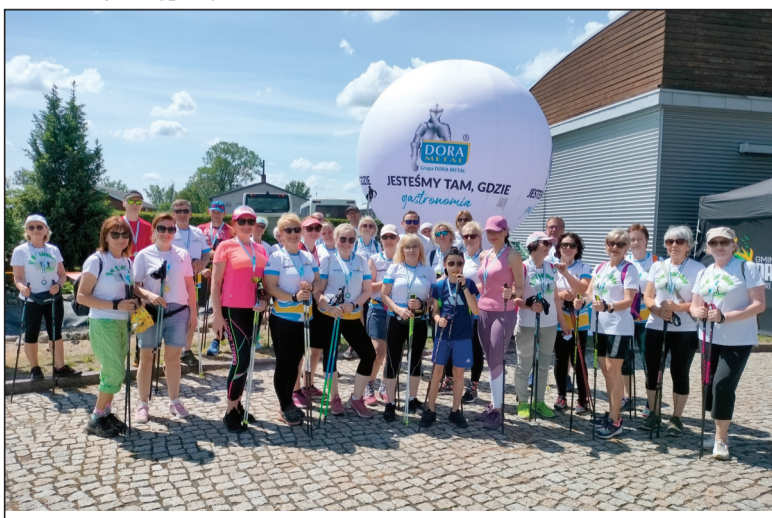
Jedni pływają, inni maszerują