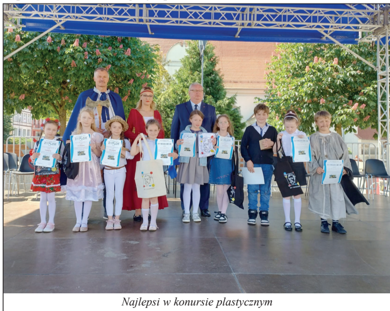
Najlepsi w konkursie plastycznym