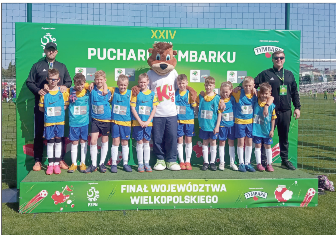
Uczestnicy rozgrywek na szczeblu wojewódzkim