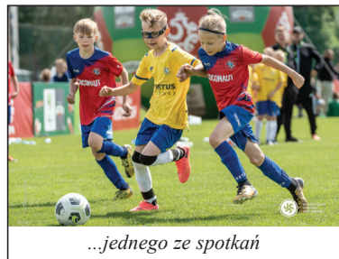
...jednego ze spotkań