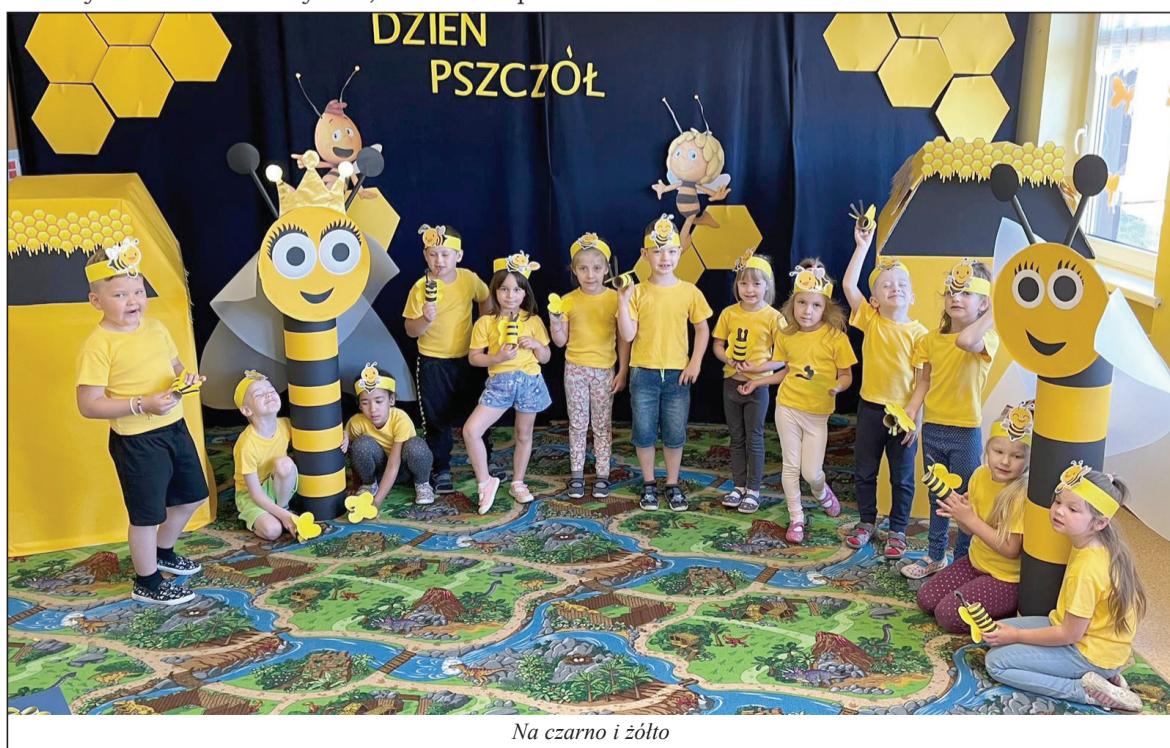
Na czarno i żółto