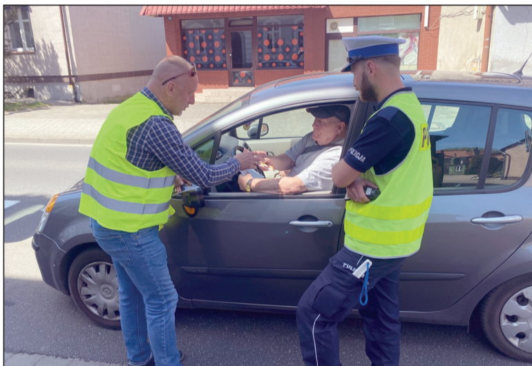
Rozmawiano z niechronionymi uczestnikami ruchu drogowego i kierowcami

W dniu 15 maja 2024 roku policjanci z czarnkowskiej „drogówki” wspólnie z przedstawicielem Wojewódzkiego Ośrodka Ruchu Drogowego w Pile na terenie Czarnkowa przeprowadzili działania profilaktyczne skierowane do niechronionych uczestników ruchu drogowego.