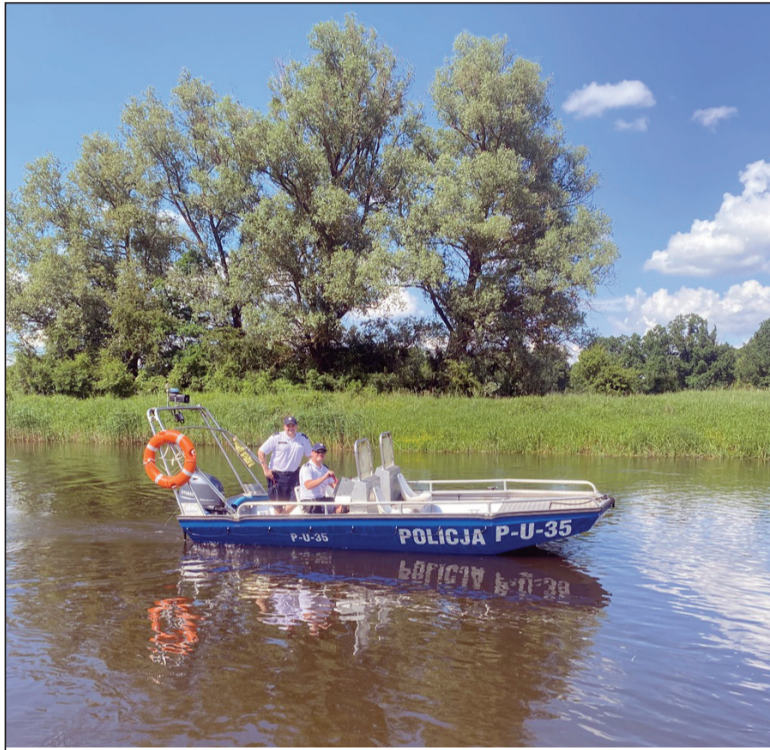
Łódź patrolowa na wodzie

W dniu 25 maja 2024 roku na terenie Bulwarów Nadnoteckich w Wieleniu odbyły się VIII Targi Produktu Lokalnego „Z Natury Najlepsze”. Uczestnicy mieli okazję odwiedzić stoisko informacyjno - edukacyjne przygotowane przez Komendę Powiatową Policji w Czarnkowie.