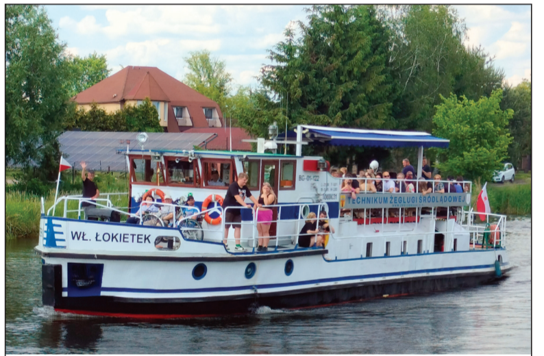
Łokietek w każdym rejsie był wypełniony po brzegi