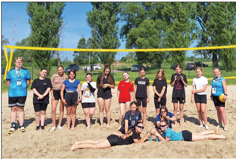
Jednym z punktów imprezy był turniej siatkówki