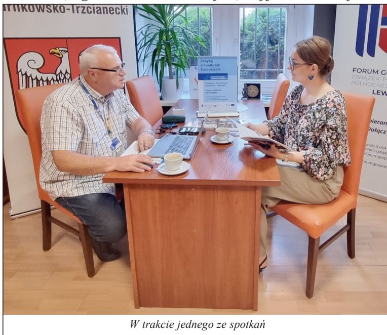
W trakcie jednego ze spotkań