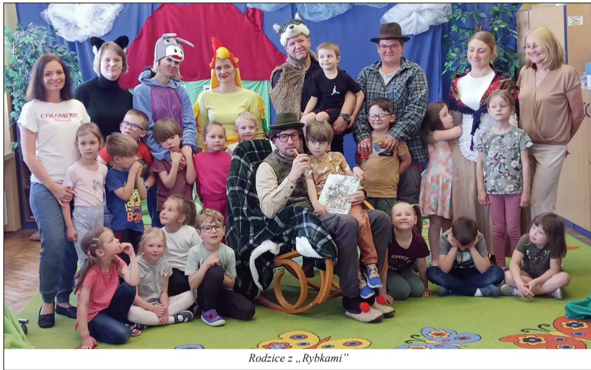
Rodzice z „Rybkami”