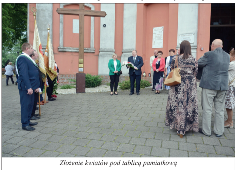
Złożenie kwiatów pod tablicą pamiątkową