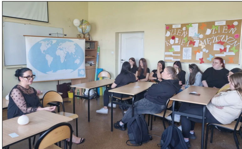
Położna z chęcią odpowiadała na pytania dziewcząt, tym samym rozwiewając wiele wątpliwości dotyczących okresu dojrzewania

Położne to specjalistki zajmujące się kobietami nie tylko w ciąży i po porodzie. W ich zawód wpisana jest opieka nad kobietami w każdym wieku - również w okresie nastoletnim. Profilaktyka i edukacja zdrowotna młodzieży ma ogromne znaczenie, a położne są doskonale przygotowane do tego, żeby uczyć młode kobiety świadomości swojego ciała.