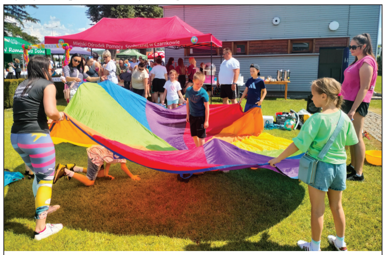
Animacje dla najmłodszych