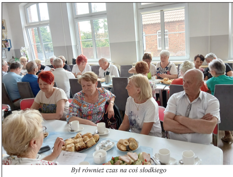
Był również czas na coś słodkiego

Klub powstał w ramach programu Fundusze Europejskie dla Wielkopolski 2021-2027 - „Usługi społeczne w gminie Lubasz” na podstawie podpisanej umowy z Ośrodkiem Wsparcia Osób Niepełnosprawnych i Niezależnych w Plewiskach a Zarządem Województwa Wielkopolskiego w Poznaniu. W zawartym porozumieniu Gmina Lubasz jest partnerem, natomiast Gminny Ośrodek Pomocy Społecznej w Lubaszu pełni funkcję realizatora. Ce-