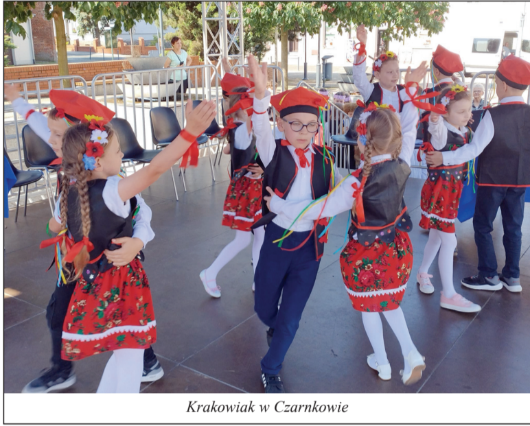
Krakowiak w Czarnkowie

Szkoła Podstawowa nr 1 w Czarnkowie pokazała na Placu Wolności jak ważny jest dla niej patron - Henryk Sienkiewicz. Dwudziestopięciolecie nadania placówce imienia jednego z najbardziej poczytnych pisarzy polskich okazało się wielkim przeżyciem dla całej szkolnej społeczności. Były tematyczne konkursy, tańce, piosenki i przedstawienia. Noblista byłby z pewnością zadowolony.