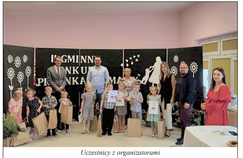
Uczestnicy z organizatorami

W środę, 22 maja br., w Gminnym Przedszkolu w Siedlisku odbył się II Gminny Konkurs Wokalny „Piosenki dla mamy”.