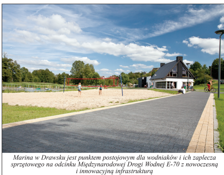
Marina w Drawsku jest punktem postojowym dla wodniaków i ich zaplecza sprzętowego na odcinku Międzynarodowej Drogi Wodnej E-70 z nowoczesną i innowacyjną infrastrukturą

Przystań Marina w Czarnkowie to nowoczesny obiekt otwarty w lipcu 20211 roku. Dysponuje wszelkimi usługami, jakie chciałby spotkać turysta wodniak. Jest miejscem do dobrego wypoczynku, relaksującego grillowania lub spróbowania swoich sił przesiadając się do kajaka czy łódki. Kolejne atrakcje czekają na turystów w centrum miasta (10 minut pieszo z przystani lub 3 minuty rowerem, który moż-