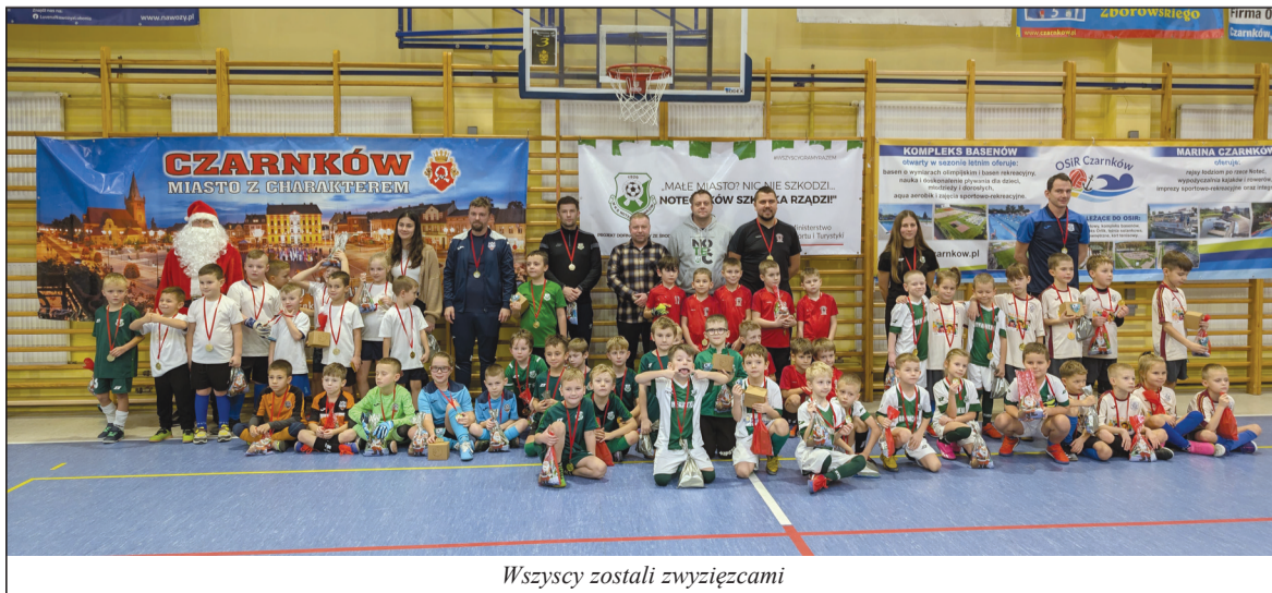
Wszyscy zostali zwycięzcami