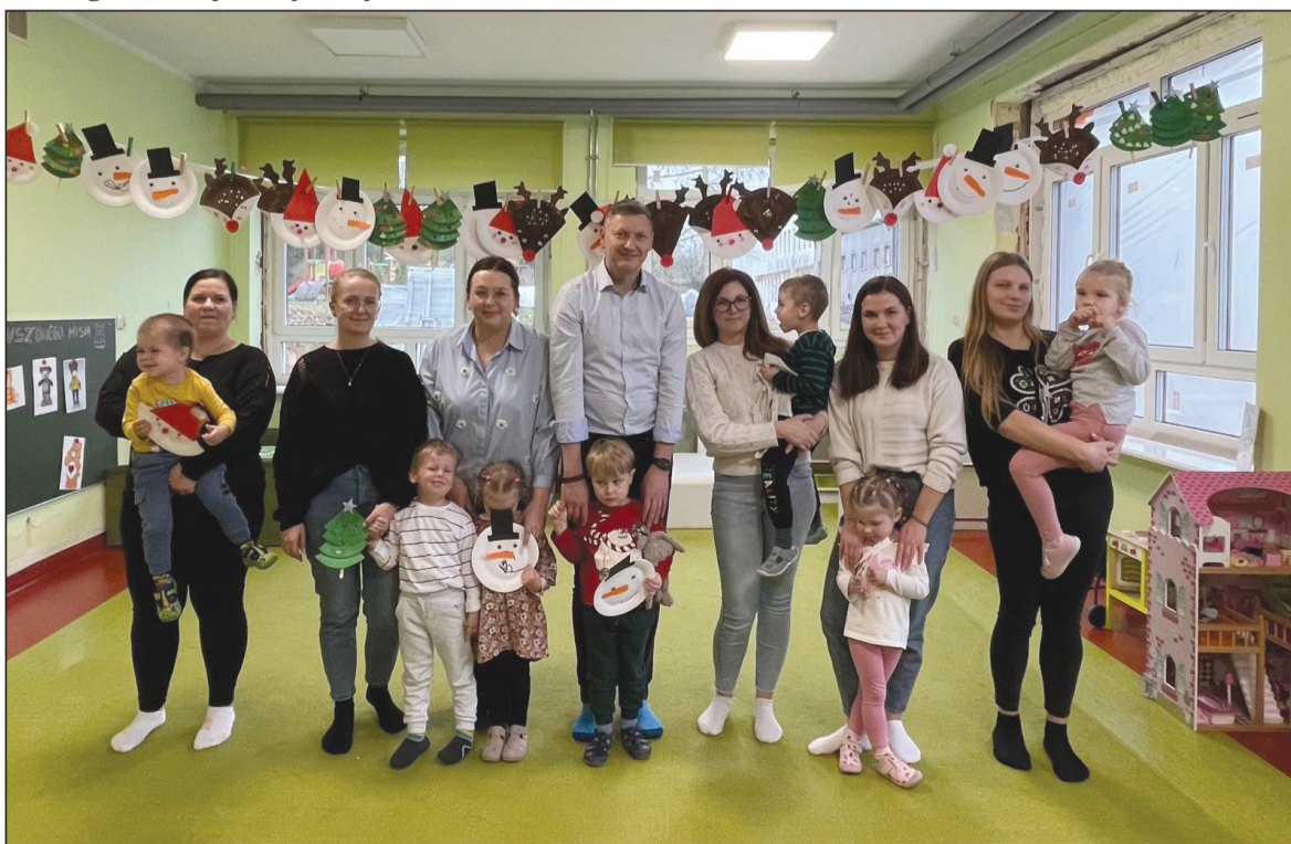
Prezentacja wspólnie wykonanych ozdób