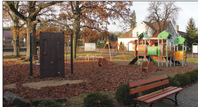
„Strefa relaksu - rewitalizacja placu zabaw dla dzieci i utworzenie miejsca do aromaterapii w Rychliku” - dofinansowanie w kwocie 61 797,00 zł

Wyremontowano zaplecze sali wiejskiej w celu utworzenia zaplecza kuchennego wraz ze składzikiem, a także wyposażono kuchnię w podstawowe sprzęty AGD. Wykonawca zadania, firma Lebud Leszek Bobik z Radolina, zrealizowała zarówno prace budowlane jak i instalacyjne w zakresie instalacji wodno - kanalizacyjnej, c.o. i elektrycznej. Swoją wkład w realizację projektu zadeklarowali również mieszkańcy Radolina, którzy zaangażowali się w prace rozbiórkowe podłogi na zapleczu oraz w oczyszczenie jednej ze ścian z tynku i zabrudzeń w celu odzyskania oryginalnej ściany z cegły.