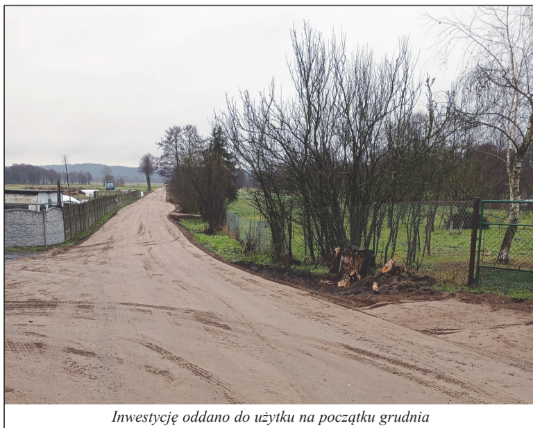
Inwestycję oddano do użytku na początku grudnia