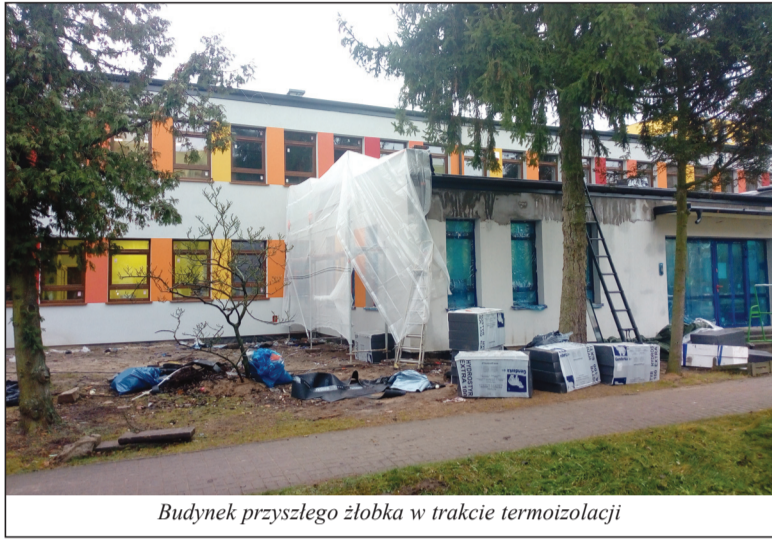
Budynek przyszłego żłobka w trakcie termoizolacji

Zgodnie z wynikami V tury naboru ciągłego w ramach Programu Aktywny Maluch 2022 - 2029 ogłoszonymi przez Ministra Rodziny i Polityki Społecznej 29 listopada 2024 roku Miasto Czarnków otrzymało dofinansowanie w kwocie 2 264 302 zł na utworzenie żłobka miejskiego, co pozwoli na zorganizowanie 32 miejsc opieki dla dzieci do 3 roku życia.