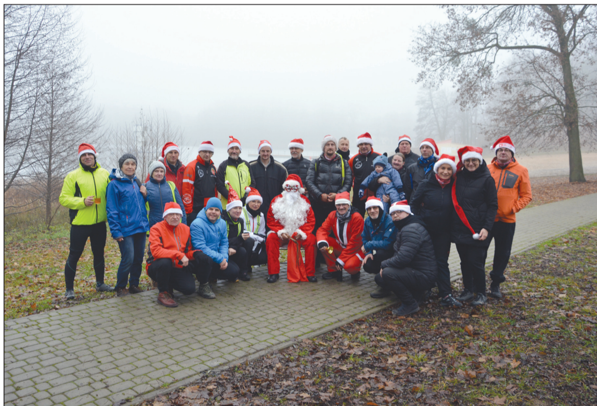
Rajdowicze na tle skąpanego we mgle jeziora Dużego w Lubasz