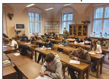
Młodzież miała 45 minut na wykazanie się wiedzą

Jest to związane z przypadającym 1 grudnia Światowym Dniem walki z AIDS - chorobą wywołaną przez wirus HIV. Dzień ten przypomina o tym, że jest to walka, której ciągle nie wygraliśmy - jedynym sposobem, aby osiągnąć na tym polu sukces jest edukacja na temat zachowań prozdrowotnych.