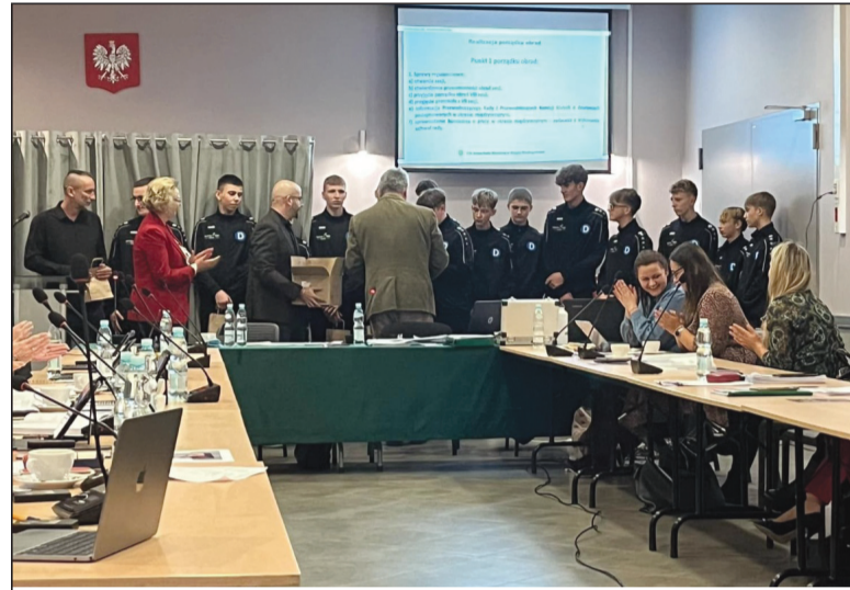
Juniorska drużyna MKS Drawa Krzyż Wlkp.

Podczas VIII sesji Rady Miejskiej w Krzyżu Wielkopolskim, która odbyła się 28 listopada 2024 roku, miało miejsce wyjątkowe wydarzenie.