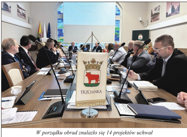
W porządku obrad znalazło się 14 projektów uchwał