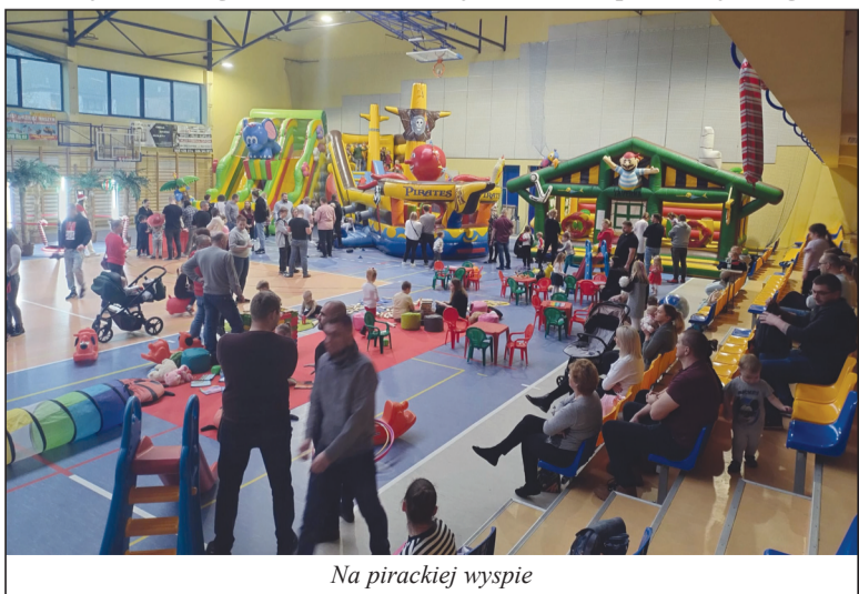
Na pirackiej wyspie