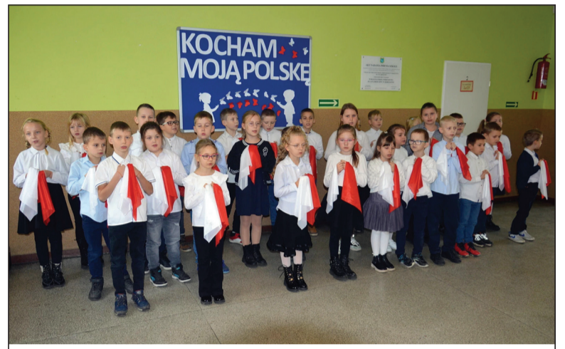
Montaż słowno - muzyczny „Kocham moją Polskę”

11 listopada 1918 roku to data ważna dla każdego Polaka. W tym dniu, po 123 latach zaborów i walki o ojczyznę, Polska powróciła na mapę Europy jako suwerenne państwo.