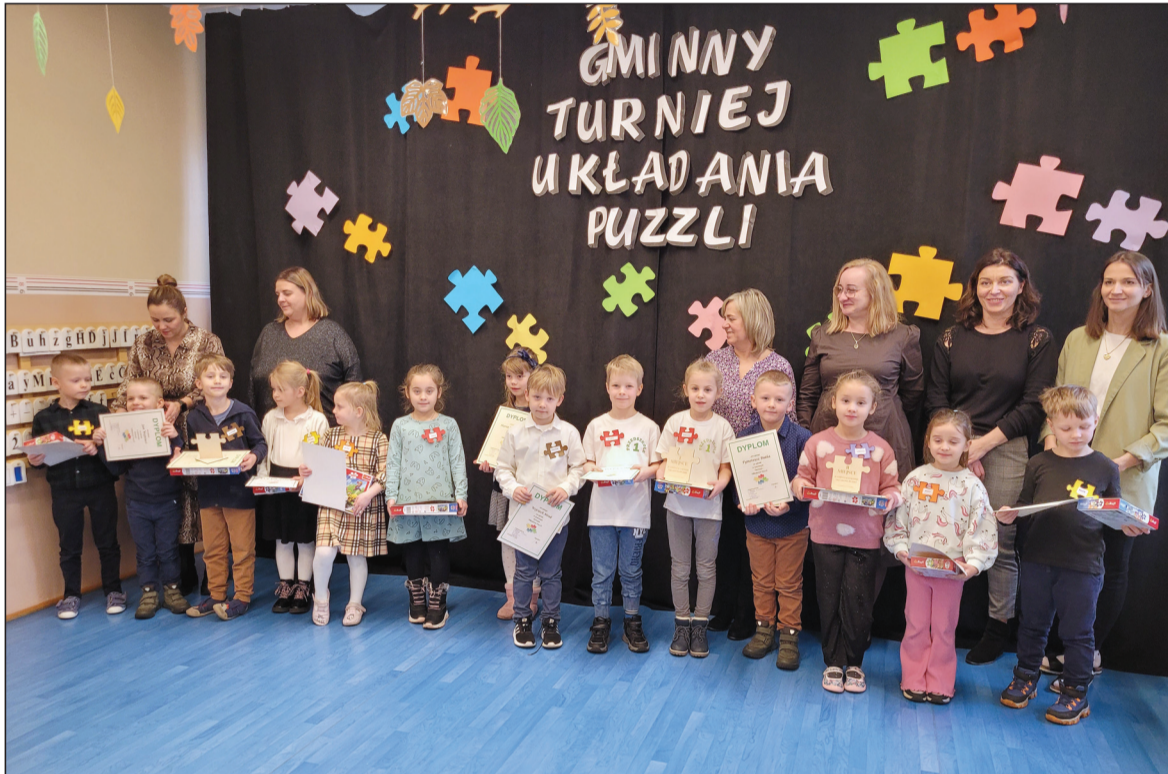
Nagrodzono wszystkich startujących