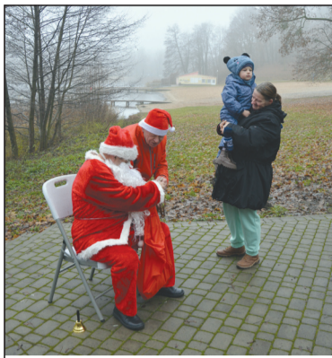
Mikołaj osobiście wręczał prezenty, nawet tym mniej grzecznym

Pierwsza sobota grudnia przypominała bardziej początek niż koniec jesieni. Słupki w termometrach dotarły do piątej kreski, wiało umiarkowanie, a utrzymująca się cały dzień mgła czasem przeradzała się w lekką mżawkę. Drogi były mokre, a na tych nieutwardzonych, które stanowiły połowę wycieczki, często padały kałuże i błotniste miejsca. Trudno było poczuć magię świąt, którą na szczęście przywoływali uczestnicy w czerwono - białych czapkach, a nierzadko w kompletnych strojach Mikołaja. Grupa złożona z 27 osób spod Czarnkowskiego Domu Kultury promenadą dotarła do granic miasta, a następnie stromą szosą