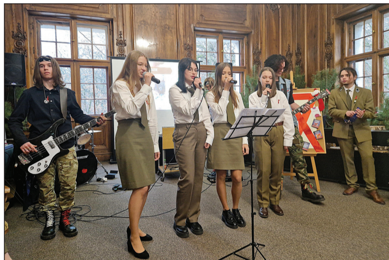
Miłym przerywnikiem były występy utalentowanej gorajskiej młodzieży

Od kilku lat, na początku grudnia, Zespół Szkół Leśnych im. inż. Jana Kloski w Goraju oraz Wydział Zdrowia i Współpracy Społecznej Starostwa Powiatowego w Czarnkowie we współpracy z Powiatową Stacją Sanitarno - Epidemiologiczną w Czarnkowie organizuje dla uczniów Powiatową Olimpiadę Wiedzy na temat HIV/AIDS oraz chorób przenoszonych drogą płciową.