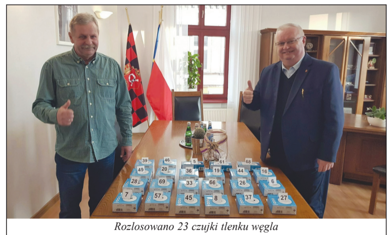
Rozlosowano 23 czujki tlenku węgla

W ramach ogólnopolskiej kampanii „Czujka na straży Twojego Bezpieczeństwa” Urząd Miasta Czarnków wraz z Ochotniczą Strażą Pożarną w Czarnkowie po raz kolejny zorganizowali konkurs ze znajomości zagrożeń jakie może spowodować tlenek węgla.