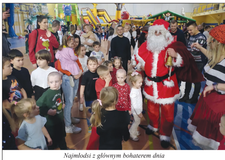
Najmłodsi z głównym bohaterem dnia

Atrakcji było bez liku. O tym co przygotowano opowiada organizatorka z poznańskiego Studia Młynek, które od pięciu lat przygotowuje imprezę - Każdego roku staramy się wymyślić inny scenariusz. Tematyka jest różna. Dziś wszystko wiąże się ze światem piratów. Są zabawy ruchowe, animacje i warsztaty, na których można wykonać gadżety, które mogą przydać się na święta, są to lampiony, origami, bombki, zawieszki i wiele innych. Dla starszych dzieci mamy symulatory lotu Mikołaja, helikoptera i jazdy motocyklem. Wszystko polega na zaangażowaniu dzieci i dorosłych we wspólną zabawę. Każdy może zaszaleć, zintegrować się, a nawet czegoś nauczyć. Dzieci są bardzo chętne do udziału w naszych propozycjach zabawach. Śpiewamy piosenki, pływamy wyimaginowanym statkiem, zbieramy kule armatnie. I co najważniejsze wypatrujemy św. Mikołaja. A ten pojawiał się nieoczekiwanie, wzbudzając entuzjastyczne okrzyki radości wśród dzieci. Do tronu, na którym zasiadł, ustawiła się długa