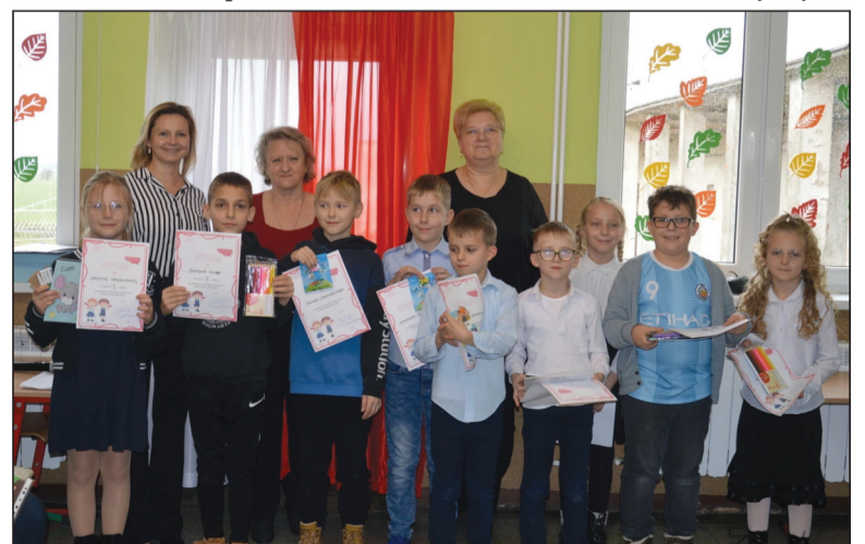
Laureaci szkolnego konkursu plastycznego