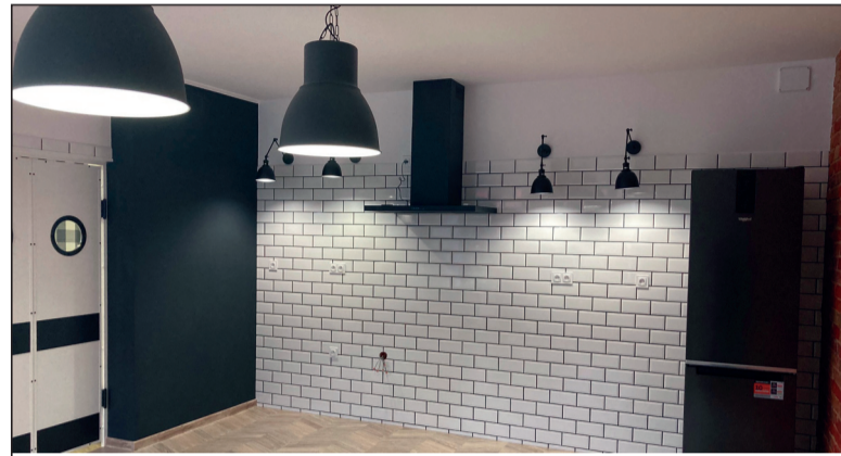
„Modernizacja sali wiejskiej w Radolinie” - dofinansowanie w kwocie 56 741,00 zł

„Pięknieje Wielkopolska Wieś” to sztandarowy i cieszący się ogromnym zainteresowaniem konkurs dotacyjny programu „Wielkopolska Odnowa Wsi”. Dzięki niemu w gminie Trzcianka powstały już między innymi Szachy pod Strzechą w Radolinie i plac zabaw w Teresinie, zmodernizowano sale wiejskie w Nowej Wsi i Białej oraz utworzono wiatę edukacyjno - rekreacyjną w Rychliku. Na tegoroczną edycję konkursu Sejmik Województwa Wielkopolskiego przeznaczył aż 11,5 mln zł na 192 projekty, a spośród nich 210 tys. zł trafiło do 3 trzcianeckich sołectw.