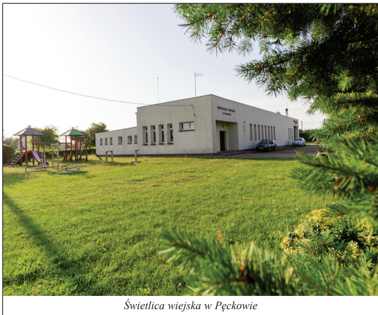
Świetlica wiejska w Pęckowie