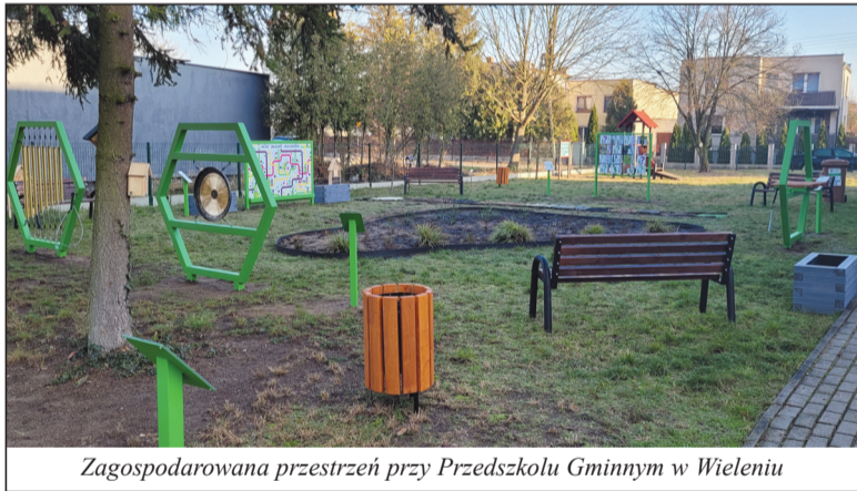
Zagospodarowana przestrzeń przy Przedszkolu Gminnym w Wieleniu