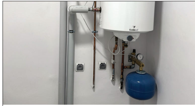
„Modernizacja sali wiejskiej w Niekursku” - dofinansowanie w kwocie 70 000,00 zł

Celem projektu była wymiana urządzeń na nowe na placu zabaw dla dzieci oraz utworzenie unikalnego miejsca do aromaterapii poprzez budowę pergoli na planie sześciokąta i obsadzenie jej aromatycznymi roślinami. Za montaż nowych urządzeń zabawowych odpowiedzialna była firma Comes Sokołowski sp. z o. o. z Szydłowca, natomiast budowę drewnianej pergoli z wyniesionymi grządkami zrealizowała firma Ciesielstwo - Dekarstwo Wiesław Kołdras z Trzcianki. Nasadzeniem roślin zajęli się mieszkańcy wsi realizując tym samym wkład własny do projektu.