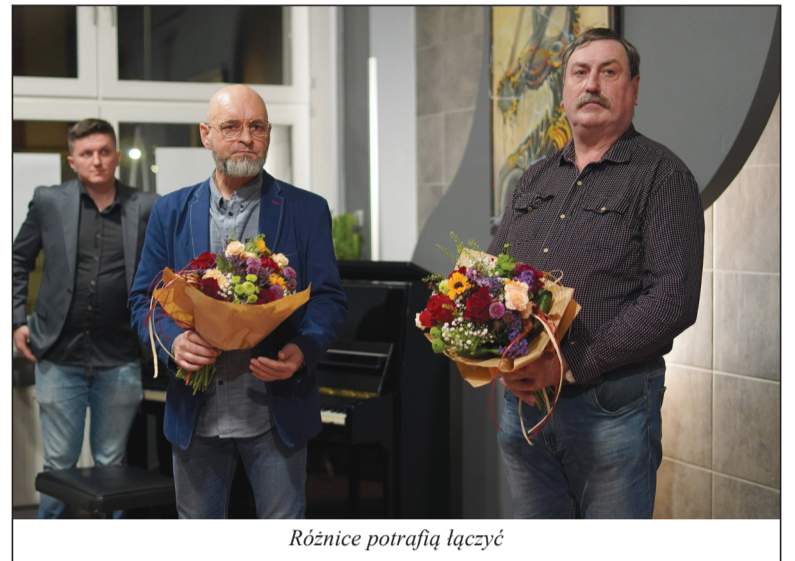
Różnice potrafią łączyć

We wtorkowy wieczór w galerii „Pięciu” Czarnkowskiego Domu Kultury odbył się szczególny wernisaż. Centrum Usług Społecznych w gminie Czarnków, przy współpracy z Gminą Czarnków i Miejskim Centrum Kultury w Czarnkowie, zorganizowało wystawę obrazów i haftów.