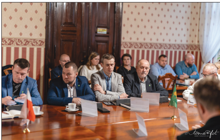
Radni podjęli kilka uchwał i wysłuchali sprawozdania z działalności wójta