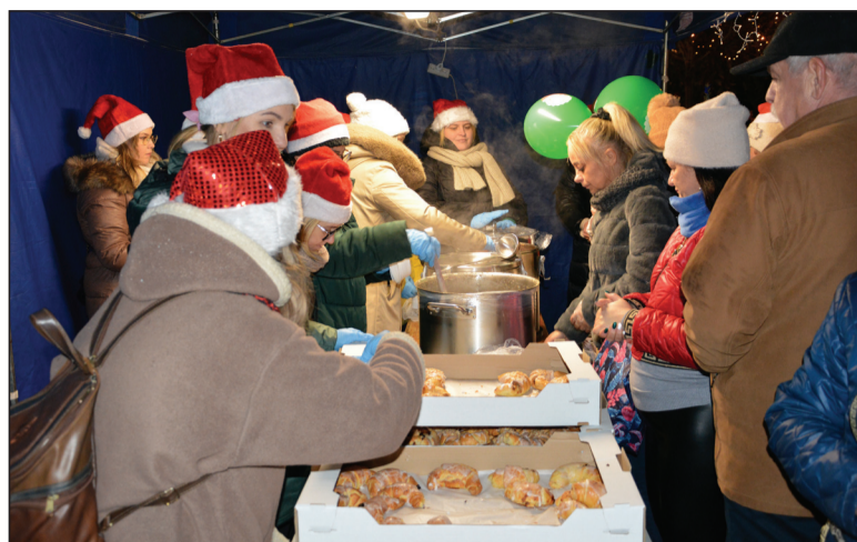
Pomidorowa, grochowa i małe co nieco

„Mikołajkowy Zawrót Głowy” był nie tylko okazją do świę-