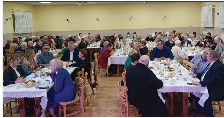
Seniorom nie brakowało chęci do wspólnego biesiadowania

W ramach Światowego Dnia Seniora, który przypada 14 listopada, Samorząd Gminy Lubasz wraz z Gminnym Ośrodkiem Pomocy Społecznej, Gminnym Ośrodkiem Kultury oraz parafią pw. Narodzenia Najświętszej Maryi Panny zorganizował uroczysty „Dzień Seniora w gminie Lubasz”, który odbył się 28 listopada 2024 roku w sali wiejskiej w Kamionce.