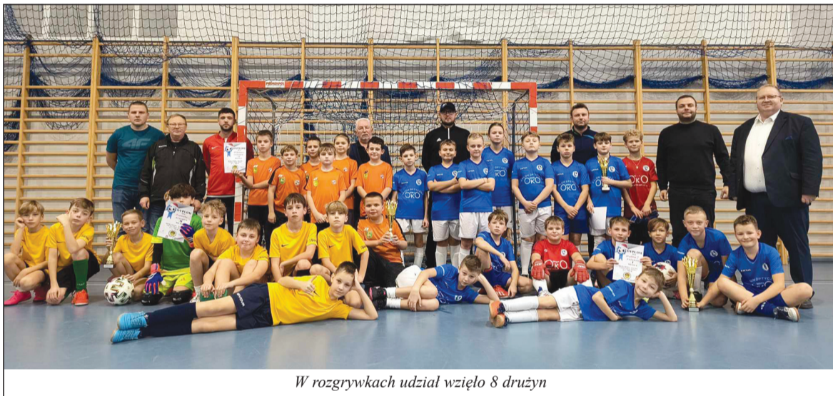
W rozgrywkach udział wzięło 8 drużyn