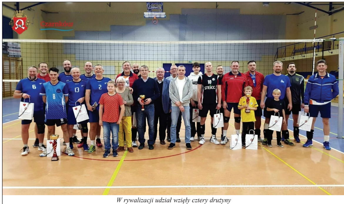
W rywalizacji udział wzięły cztery drużyny