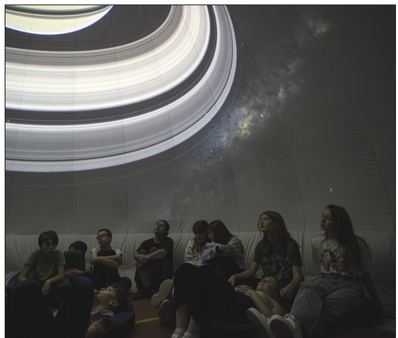
Planetobus - mobilne planetarium programu „Nauka dla Ciebie”

Inicjatywa „SOWA - Strefa Odkrywania, Wyobraźni i Aktywności” finansowana jest w ramach dotacji Ministra Nauki, na podstawie umowy Nr 1/CNK-SOWA/2021 z dnia 2.03.2021 r. w sprawie uruchomienia przez Centrum Nauki Kopernik 50 lokalnych Stref Odkrywania, Wyobraźni i Aktywności (SOWA) w latach 2021-2028.