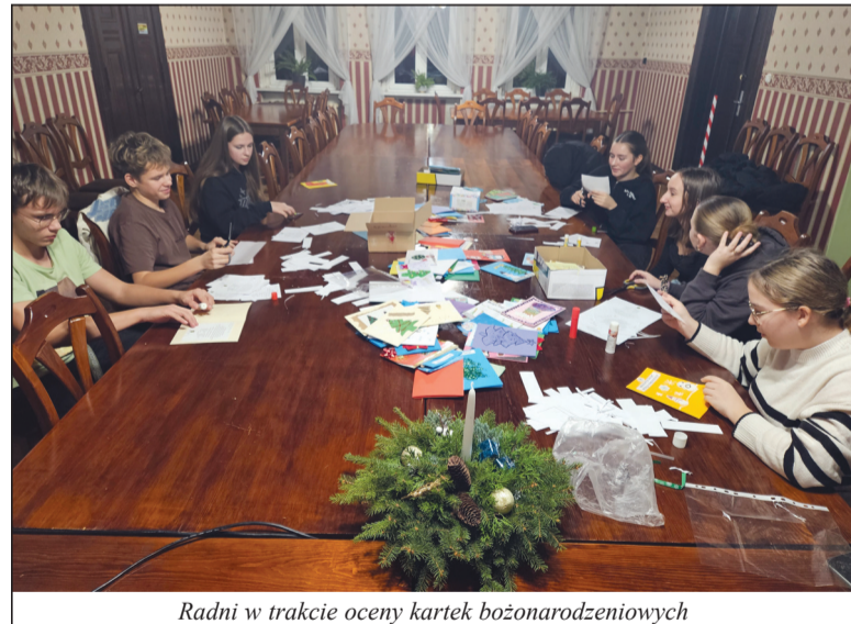
Radni w trakcie oceny kartek bożonarodzeniowych

5 grudnia odbyło się IV posiedzenie Młodzieżowej Rady Gminy Drawsko, które miało na celu weryfikację kartek bożonarodzeniowych przygotowanych przez uczniów szkół podstawowych w ramach akcji „Kartka dla seniora” oraz uchwalenie planu pracy Rady na 2025 rok.