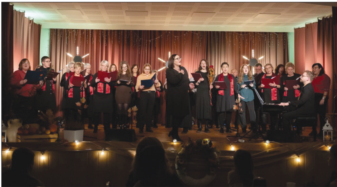
Połączone siły dwóch chórów

KATARZYNA STEFANIAK