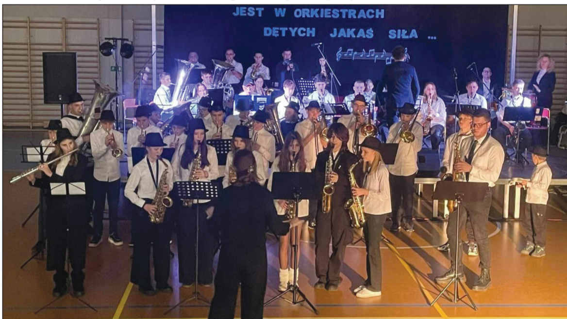
Wystąpiły orkiestry dęte z Drezdenka, Trzcianki, Wielenia, Krzyża Wlkp. i Lubasza