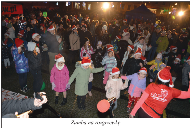
Zumba na rozgrzewkę