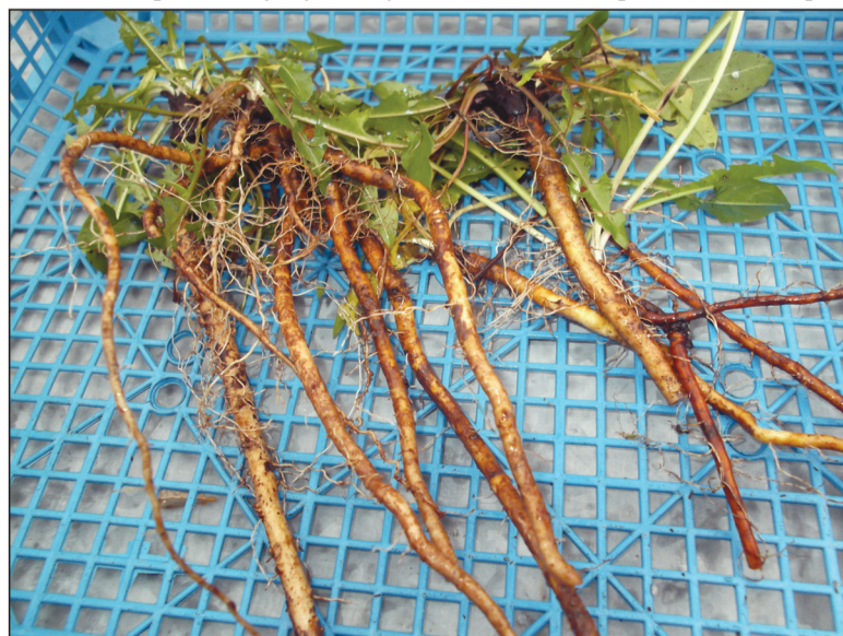
Korzenie mniszka lekarskiego świeżo wykopane w moim ogrodzie i przepłukane w skrzynce 5 grudnia 2024 roku